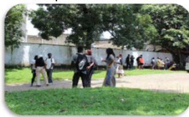
Espace de détente