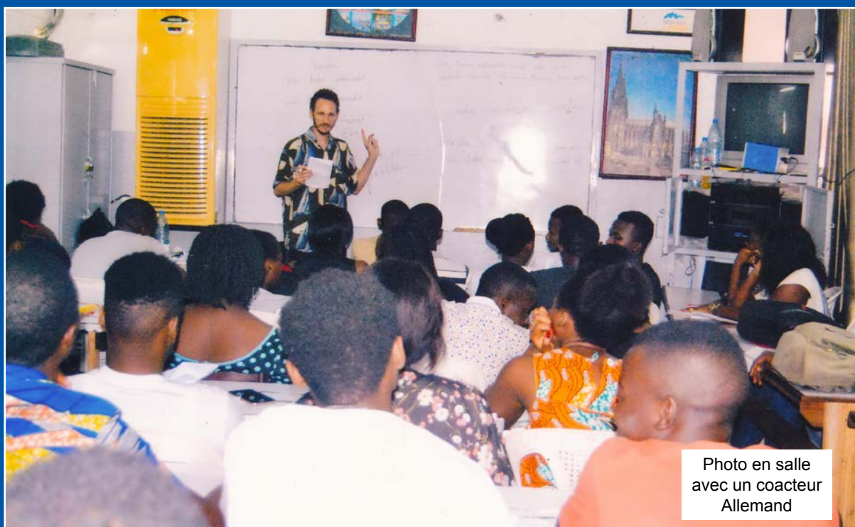
Photo en salle avec un coacteur Allemand

Pour plus d'infos, contactez : Institut de Langue Allemande – Douala, ila.douala@gmail.com · www.ila-cm.com